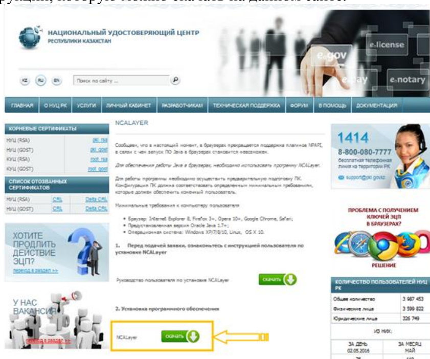
Рисунок 6 - Установка программы NCALayer

Скачать «NCALayer» можно с официального сайта Национального Удостоверяющего центра РК pki.gov.kz ( http://pki.gov.kz/index.php/ru/ncalayer ). Необходимо установить программу, следуя указаниям инсталлятора и настроить браузер согласно инструкции, которую можно скачать на данном сайте.